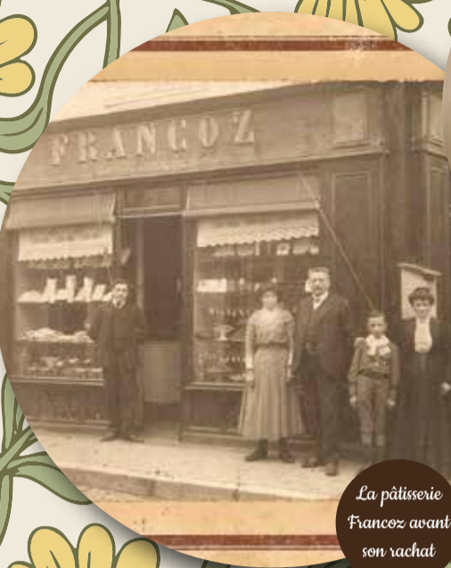
La pâtisserie Francoz avant son rachat