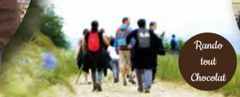
Rando tout Chocolat