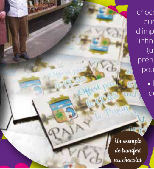
Un exemple de transfert sur chocolat