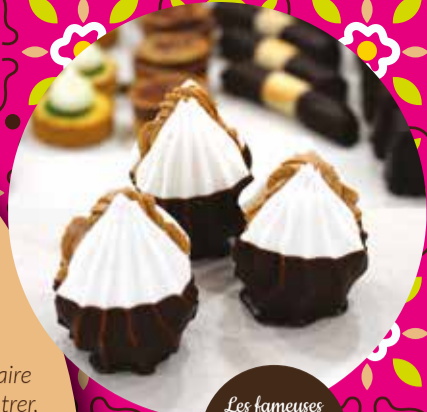
Les fameuses «bombes atomiques»

« J'ai grandi dans les années 30 dans une famille modeste. Les jours de fête, nous venions acheter des «brises» chez Jouvenal, c'étaient des chutes de gâteaux qui étaient vendues à prix réduit. »