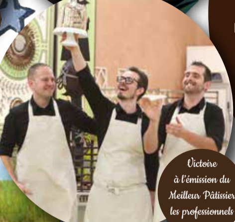
Victoire à l'émission du Meilleur Pâtissier les professionnels