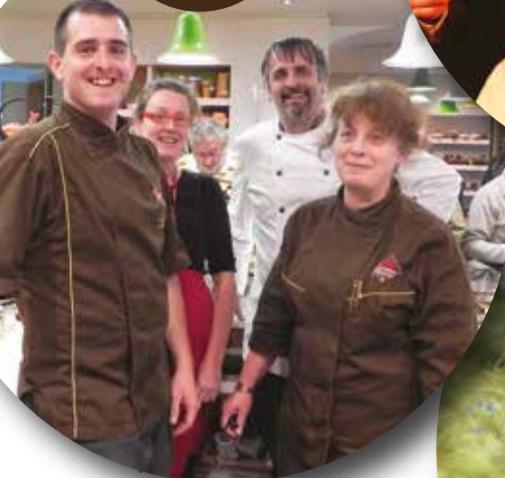
La famille Jovenal le soir de l'inauguration de la nouvelle boutique