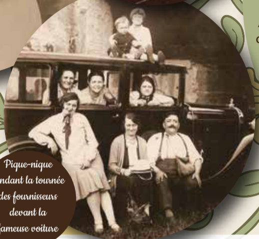
Pique-nique pendant la tournée des fournisseurs devant la fameuse voiture