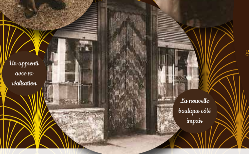
Un apprenti avec sa réalisation